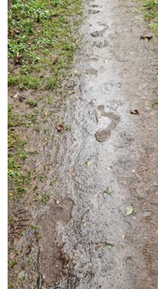
Pfad in Lambrecht