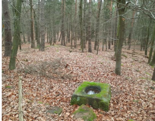
Alte Viehtränke auf dem Höhenrücken