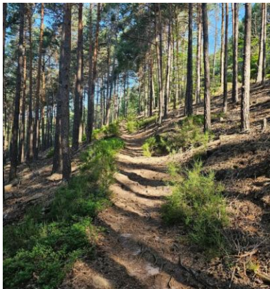
Der Weg bergauf