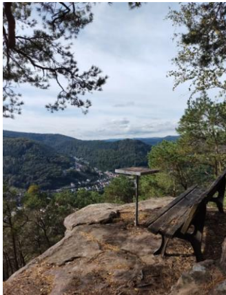
Blick auf Lambrecht am Teufelsfelsen